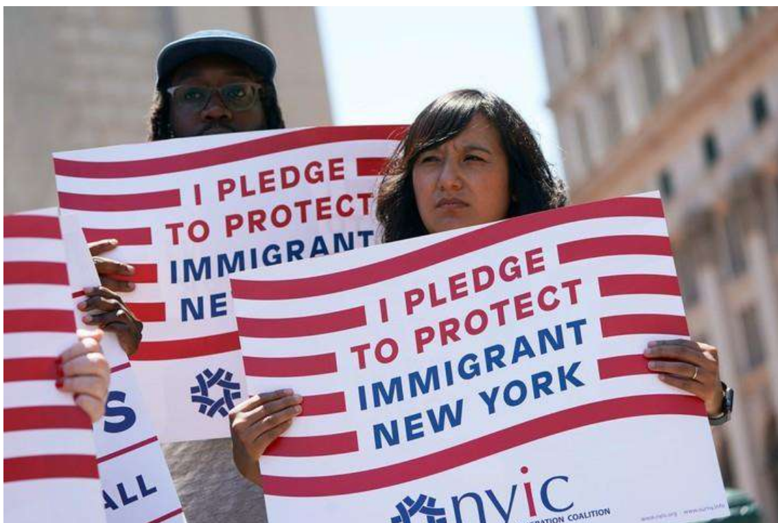
Una protesta de miembros de la Coalición de Inmigrantes de Nueva York contra el apoyo de la Corte Suprema de EE.UU. al veto migratorio de Donald Trump.

Por ello, la Academia de Ciencias Morales y Políticas de Argentina, con motivo de su 80° aniversario, organizó en Buenos Aires el Encuentro Iberoamericano con las Academias homólogas de España, Chile, Perú y Venezuela, donde se eligió como tema los “Desafíos de la democracia en el siglo XXI: fortalezas y riesgos políticos, económicos, sociales, culturales e internacionales”.