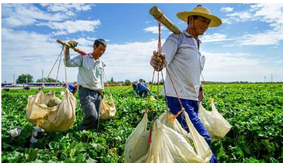
Agricultores del noroeste de China transportan melones Hami recién cosechados.